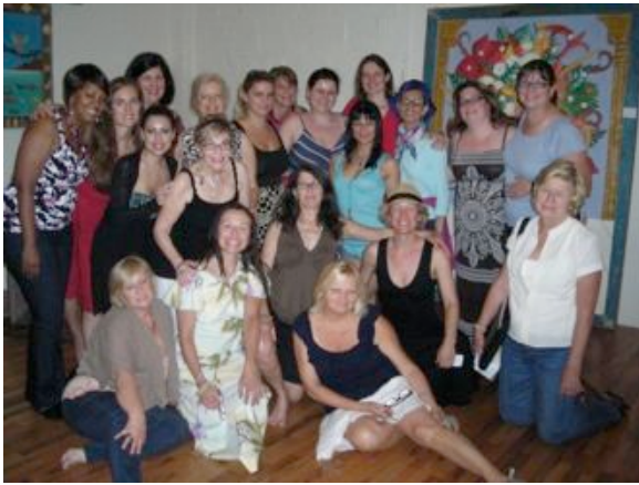
Feminine Mystique – New York